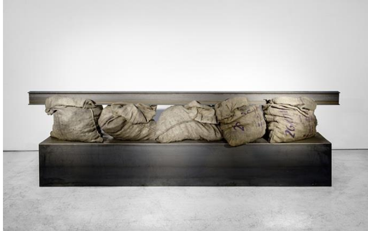
Jannis Kounellis - FIAC

Arta conceptuală apare la mijlocul anilor 1960 ca reacție împotriva formalismului punând pe primul plan ideea, concepția, procesul operei, considerate mai semnificative decât forma concretă a operei în sine. Artistul francez Marcel Duchamp a pregătit calea conceptualiștilor prin unele din lucrările sale, care refuzau orice categorisire. Așa cum apare în prezent, arta conceptuală este o modalitate de autoanaliză, de prezentare a laboratorului de creație, într-un amestec de imagini pictate, fotografii și inscripții sub forma unui asamblaj. Cratorul oferă "spectacolul" lucrului său, ceea ce conform tradiției era de regulă ascuns receptorului, căruia i se ofereau doar opere finite.